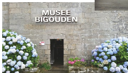
Visite du musée et de Pont L 'Abbé

En EPS , les sports collectifs pour fonctionner en équipe , un cycle de musculation cette année pour travailler les différents muscles. Un travail sur la respiration et sur la compréhension du fonctionnement de son corps est également mis en place!