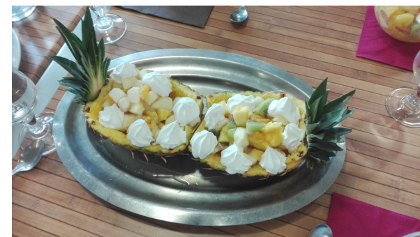
Réalisation des élèves

C'est aussi l'occasion de participer à des projets divers en partenariat avec des écoles maternelles et primaires ou d'autres établissements extérieurs, organiser des ateliers lors de la semaine du goût par exemple.