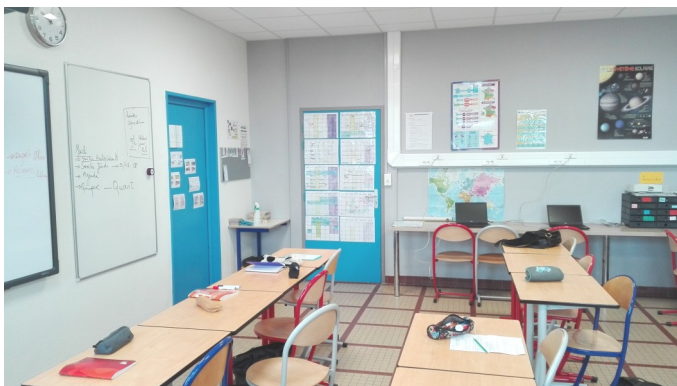
Les cours se déroulent dans une salle dédiée à l'ULIS

Le parcours est prévu sur deux ans mais la durée varie en fonction de la situation