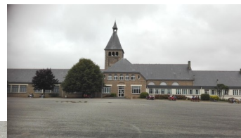
Découverte du lycée

En projets , les élèves découvrent les lieux autour du lycée, la mer et la ville et apprennent à utiliser une carte, prendre le bus et se repérer dans la ville.