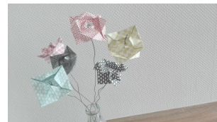
Réalisé par les élèves

En EPS , les sports collectifs pour fonctionner en équipe , un cycle de musculation cette année pour travailler les différents muscles. Un travail sur la respiration et sur la compréhension du fonctionnement de son corps est également mis en place!