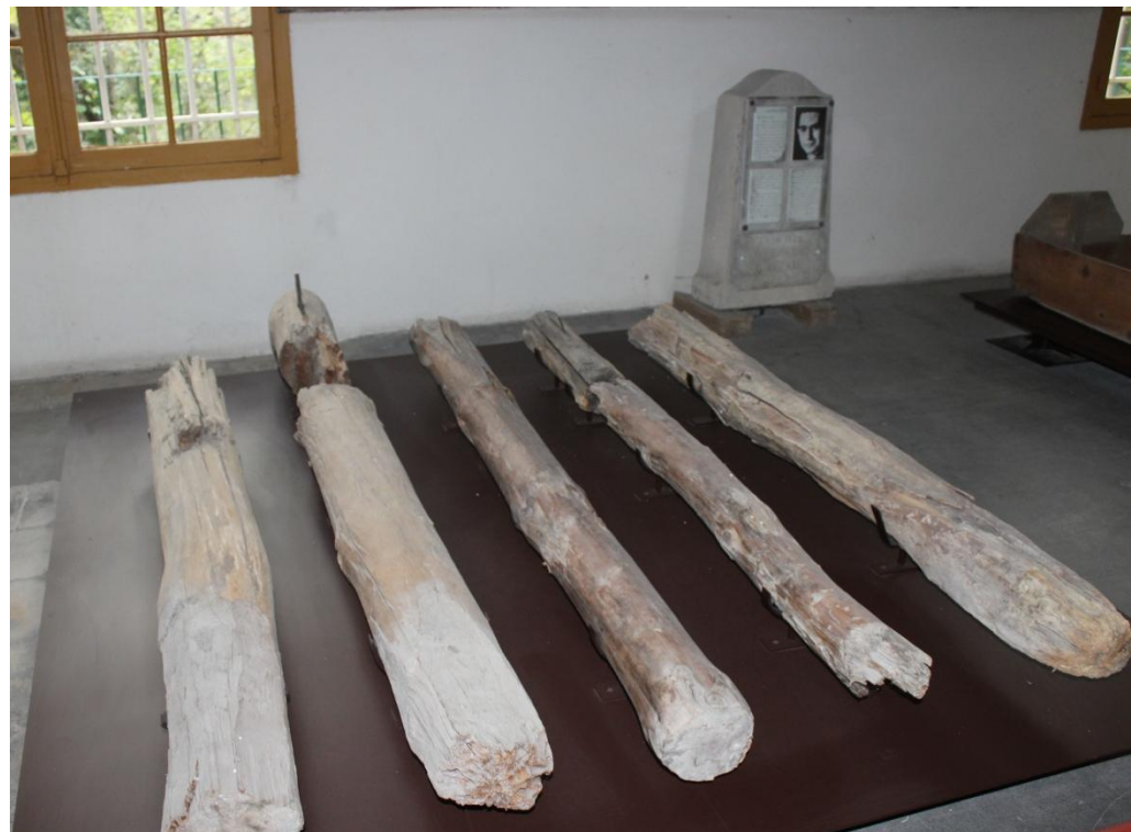
Les poteaux d'exécution