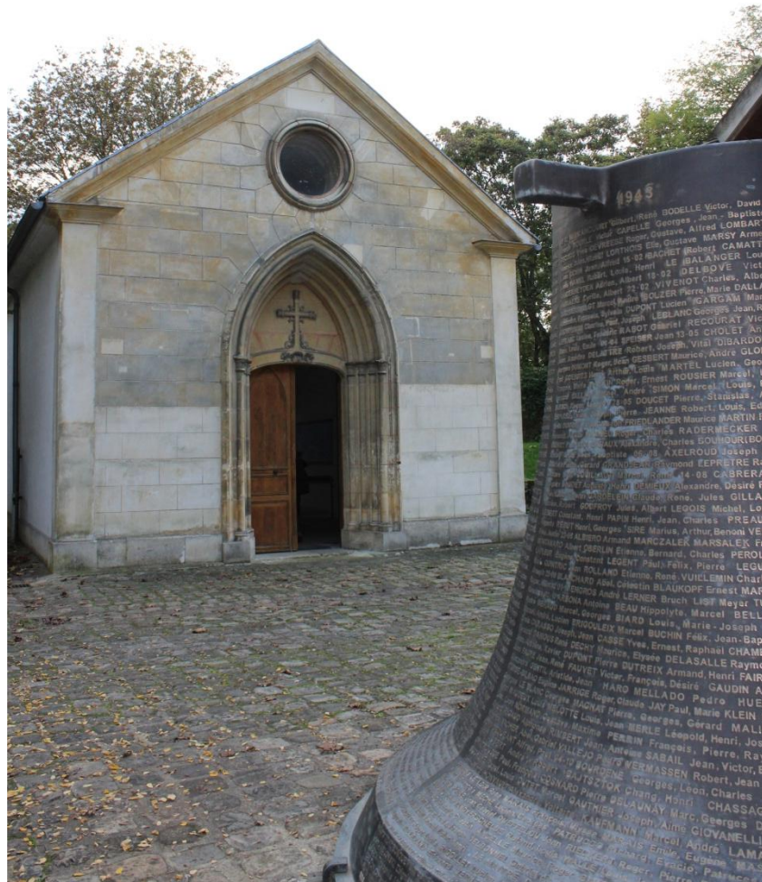
La chapelle des fusillés