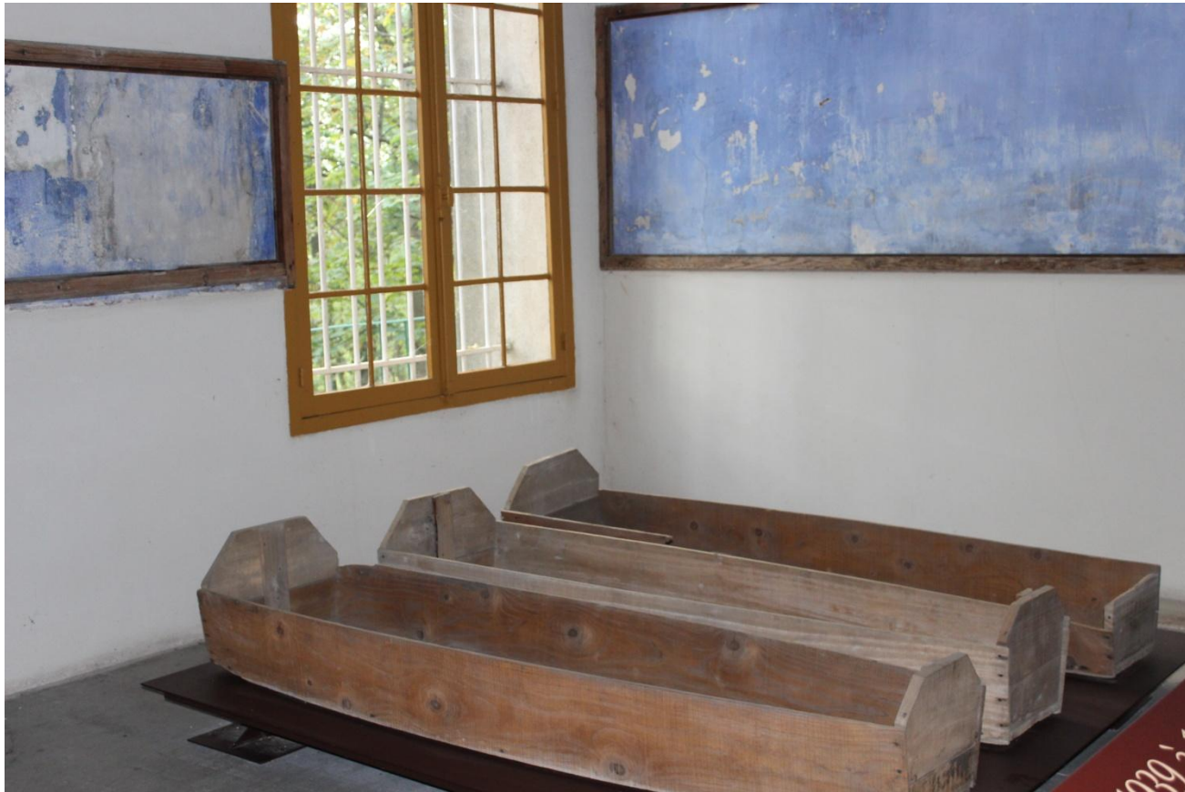
Cercueils servant au transport des corps jusqu'aux lieux de sépulture.