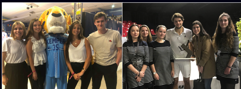
Partenaires de l'UJAP QUIMPER 29 (Basket) et de l'open ATP challenger de QUIMPER (Tennis)